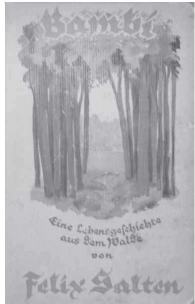
Salten, F.: Bambi. Eine Lebensgeschichte aus dem Walde . Ullstein Verlag, Wien 1923.

Als Tierroman ist Saltens Bambi in mehrere Zusammenhänge zu stellen. Im Vergleich mit klassischen Tiererzählungen kommt als Vorläufer Rudyard Kiplings Dschungelbuch (1894/95, dt. 1898) in Betracht, das auch als Prototyp der kolonialen Literatur gilt. Beiden gemeinsam ist das, wenn auch unterschiedliche, Leben unter Tieren mit, ebenfalls divergierender, Beziehung zum Menschen. Von unmittelbarem Einfluss dürften aber die Tierbücher von Ebner-Eschenbach gewesen sein, mit der Sal-