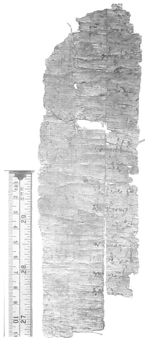
P. Vindob. G 18884