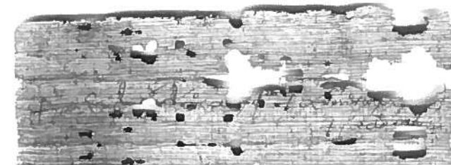
P. Vindob. G 1620 recto e verso