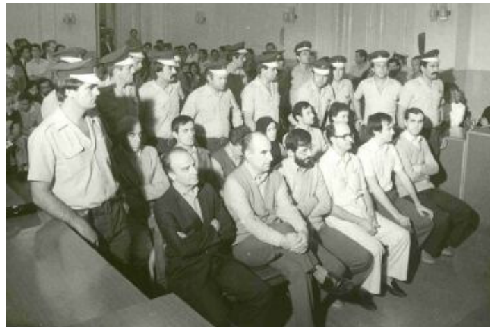
Der Prozess gegen Alija Izetbegović und seine Gefolgsleute (20.08.1983, Sarajevo)