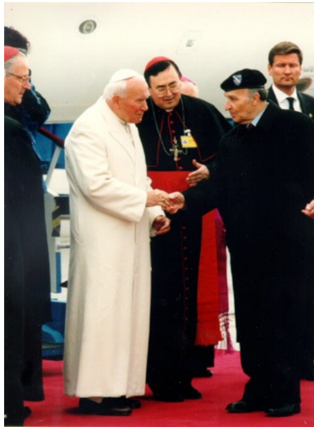
Papst John Paul II und Alija Izetbegović (12.04.1997, Sarajevo)