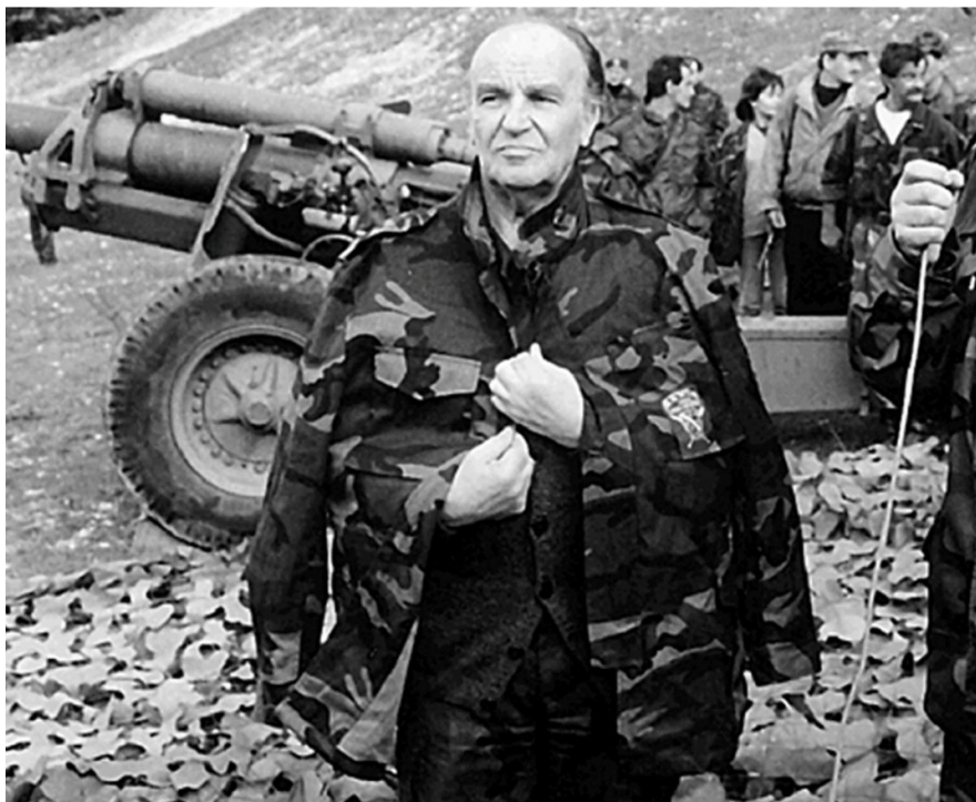
Izetbegović Als Kommandant in den Kriegszeiten