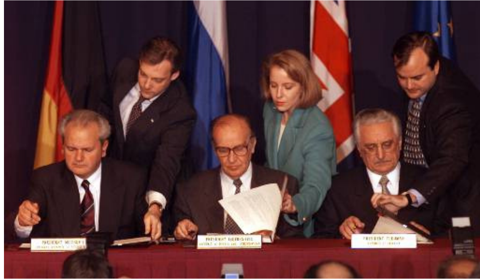
In Paris wird der Vertrag von Dayton unterzeichnet (14.12.1995) Vertragspartner: Serbiens Präsident Slobodan Milosevic, Bosniens Staatschef Alija Izetbegović, und Kroatiens Präsident Franjo Tudjman.