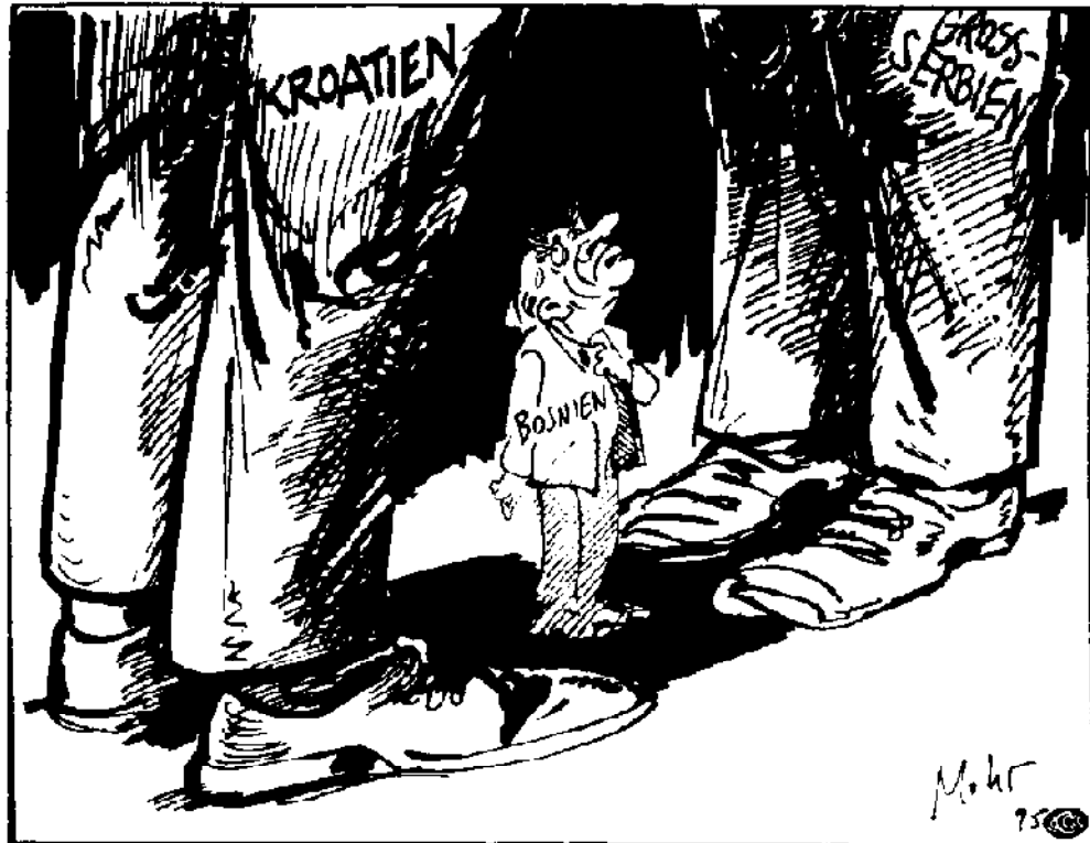
Zeichnung: Burkhard Mohr, „Dazwischen“ in: Bundeszentrale für politische Bildung Baden-Württemberg, Der Zerfall Jugoslawiens. Politik und Unterricht (Bonn, 1996), Seite.34