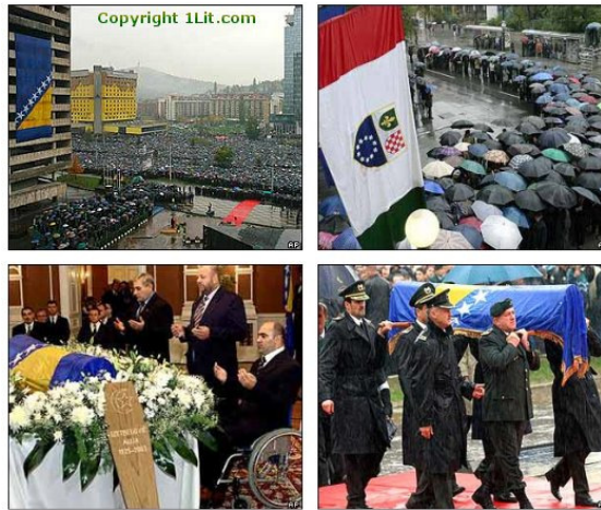
Abschied von Alija Izetbegović (22.10.2003, Sarajevo)