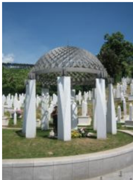
Grab von Alija Izetbegović in Sarajevo