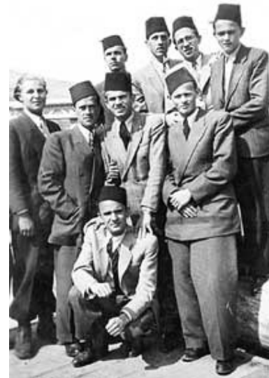
Izetbegović in seiner Jugend