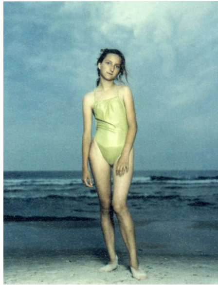
Figure A.3: Rineke Dijkstra, Kolobrzeg