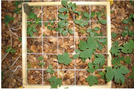
Abb. 3. Frequenzplot am IP1

Alter mittels Zählen der Knospennarben geschätzt. Die Jungbäume wurden auf Verbisschäden des Haupttriebes untersucht (ja/nein) und die Länge des Haupttriebes von 2006 und 2007 wurde gemessen. Auf Basis dieser Daten leiteten wir die abhängigen Variablen für die anschließenden Regressionsanalysen ab.