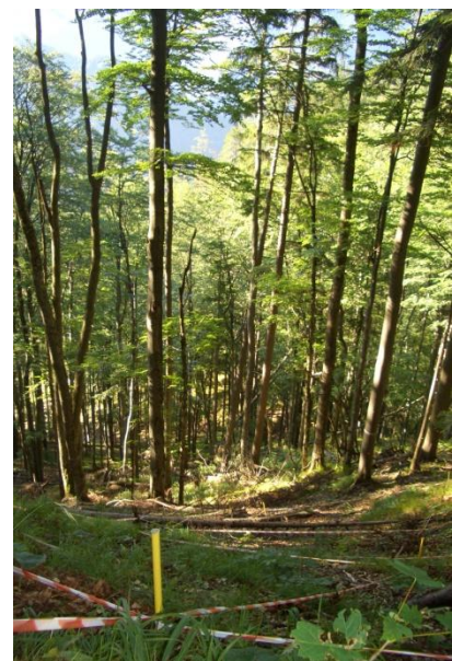
Abb. 2. Intensivplot 2 (IP2)