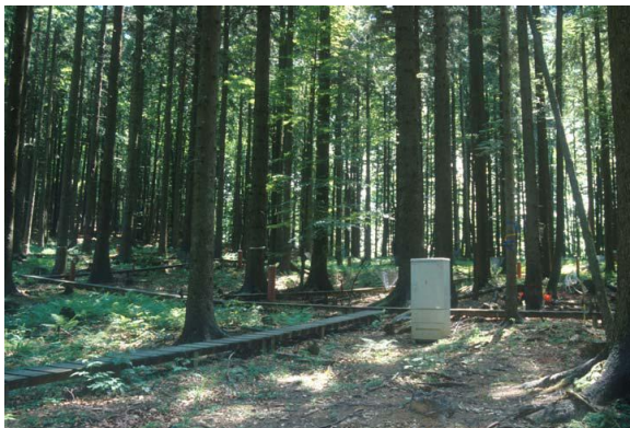
Abb. 1. Intensivplot 1 (IP 1)

Die Vegetationsuntersuchungen wurden an zwei Dauerflächen (Intensivplots) des Zöbelbodens durchgeführt. Intensivplot 1 befindet sich auf einem Hochplateau eines Fichtenwirtschaftswaldes, der seit zirka 1910 forstwirtschaftlich nicht mehr genutzt wird (Abb. 1). Intensivplot 2 liegt an einem nord-westlich exponierten Steilhang, der weitgehend von einem naturnahen Buchenmischwald geprägt wird (Abb. 2).