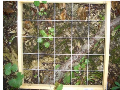
Abb. 4. Frequenzplot am IP2

Als Response für die Keimung wurde die Anzahl der ein bis fünf jährigen Baumkeimlinge, die im Jahre 2007 aufgenommenen wurden, definiert. Die Überlebensrate wurde als das Verhältnis der Anzahl der vier bis neun jährigen Baumkeimlinge des Jahres 2007 zu der Anzahl der ein bis fünf jährigen Baumkeimlingen des Jahres 2004 berechnet. Die Wachstumsrate wurde vom durchschnittlichen Haupttrieblängenzuwachs des Jahres 2006 und 2007 von unverbissenen Baumindividuen abgeleitet.