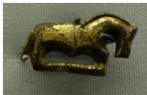
Abb. 13: Pferdchenfibel Weingarten 111, M 1:1;

Diese Aussagen bestätigen sich in Hinblick auf die Pferdchenfibelfunde der untersuchten