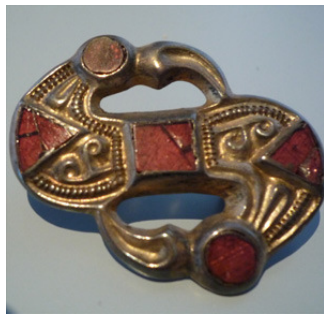
Abb. 11: S-Vogelkopffibel Weingarten 179, M:1:1;

In Weingarten wurden insgesamt sieben Gräber mit einer S-Vogelkopffibel-Beigabe freigelegt. Es handelt sich ausschließlich um die in SW II datierten Bestattungen adulter bis maturer Frauen, die ihre Fibel(n) in üblicher Weise im Kopf/ Hals/ Schulterbereich trugen. Die S-Fibeln bestehen aus vergoldetem Silber, sind in den meisten Fällen mit einer Almandineinlage sowie mit Kerbschnittdekor verziert und treten einzeln, paarweise und in Vierfibeltracht auf.