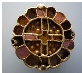
Abb. 20: Scheibenfibel Weingarten 737, M 1:1

Zeit angehören, die über die Bedeutung des Kreuzsymbols Bescheid wusste. Befinden sie womöglich weitere kreuzverzierte Funde in Gesellschaft solcher Scheibenfibeln in den Gräbern, so festigt dies natürlich die Annahme die bestattete Person gehöre dem christlichen Glauben an. (MÜLLER, QUAST 1987: 18)