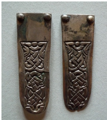
Abb. 17: Riemenzungen Stil II Weingarten 178, M 1:1;

Wadenbinden zeigen seltener Tierstil II-Dekor als Schuhschnallengarnituren. Zum Großteil zeigen sich die Tierverzierungen an den Riemenzungen, die natürlich mehr Platz dafür bieten als die übrigen Bestandteile. Bis auf ein silbernes Paar aus Weingarten, bestehen sie zum überwiegenden Teil aus Bronze. Im Unterschied zu den Schuhschnallengarnituren befinden sie sich knapp über die Hälfte in Gräbern die Edelmetallfunde enthalten. Objekte mit Kreuzdekor sind darin in der Fällern zu finden, jedoch muss vermerkt werden dass sich darunter auch gestörte Bestattungen befinden.