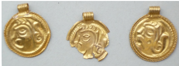
Abb. 7: Brakteaten Weingarten Grab 470, Maßstab 1:1;

Der Begriff „Brakteat“ bezeichnet runde, einseitig geprägte Goldbleche mit einem Durchmesser von 2 bis 3 cm. Sie wurden mittels eines geschnittenen oder gegossenen Modells einseitig gepresst und mit einer Öse versehen. (MUNKSGAARD 1978: 338)