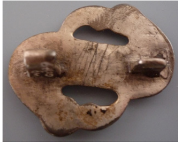
Abb. 8: S-Fibel mit Runeninschrift Weingarten 179, M 1:1;

Die Inschrift auf der S-Vogelkopffibel aus Grab 272 desselben Gräberfeldes lautet vermutlich