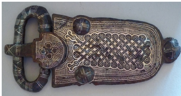
Abb. 16: Gürtelschnalle Weingarten 379, M 1:2;

Grab 379 von Weingarten enthielt eine übermäßig große, eiserne Gürtelschnalle deren Beschlag mit Flechtbändern, an deren Enden sich zwei eindeutig dargestellte Schlangenköpfe befinden und Andreas-kreuzdekor verziert. Zur Bedeutung dieser Tiere s. Kapitel 4.4.