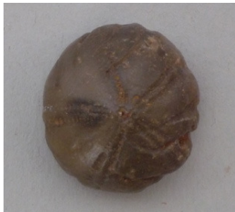
Abb. 2: Seeigel Weingarten 713, M 1:1;

In welcher Weise fossile Seeigel benützt wurden liegt völlig im Dunkeln, eine kultische Funktion ist vermutlich anzunehmen.