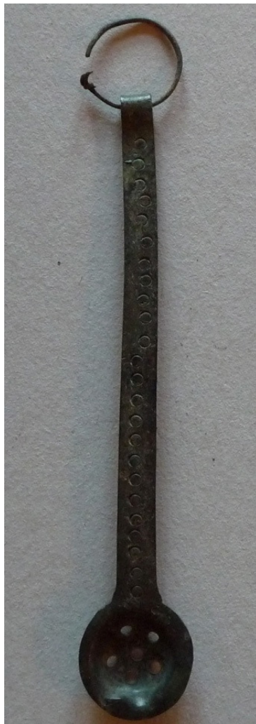
Abb. 6: Sieblöffel Weingarten 234, M 1:1;

Gräber mit Sieblöffel beinhalten mehrfach eine Edelmetallbeigabe, wobei das wertvolle Mate-