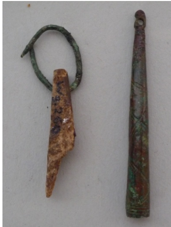
Abb. 3: Herkuleskeulen Weingarten 260/579, M 1:1;

In Weingarten konnte aus fünf Gräbern jeweils eine Herkuleskeule freigelegt werden.