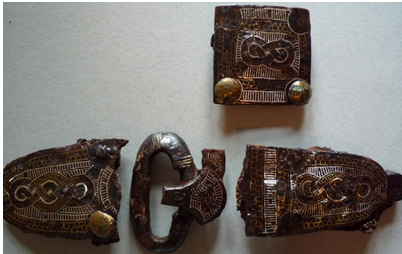
Abb. 15: Gürtelgarnitur mit Flechtbandverzierung Weingarten 595, M 1:2;

Flechtbanddekor ist überaus häufig an Gürtelgarnituren zu beobachten. Diese bestehen aus Eisen, wobei die Verzierung mehrheitlich in Silber, seltener in Messing tauschiert ist. Derartig gestaltete Gürtelgarnituren lassen sich in jedem der elf untersuchten Gräberfelder, außer in Basel-Bernerring