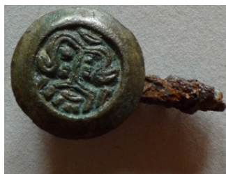
Abb. 9: Saxscheidenknopf Weingarten 148, M 1:1;

Im Vergleich zu Tiermotiven treten Gesichts- und Maskendarstellungen im untersuchten Rahmen generell selten auf.