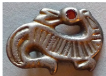
Abb. 14: S-förmige Tierfibel Weingarten 740 M 1:1;

In Weingarten gibt es jeweils zwei Gräber mit einem S-förmigen Tierfibelpaar und einem S-Fibelpaar mit Tierkopfen. Erstgenannte datieren in SW III, Zweitgenannte in SW II. Die Fibeln wurden durchwegs in typischer