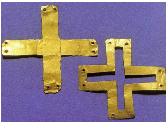
Abb. 18: Goldblattkreuze Weingarten 615, M 1:1;

Goldblattkreuze wurden aus getriebenen Blechen von 0,04 bis 0,1 mm Dicke ausgeschnitten, wobei dies oftmals auf unachtsame Weise, ohne die Regeln der Symmetrie und die Wahrung der richtigen Maße zu beachten, geschah. Sie bestehen aus Legierungen von Gold und Silber mit Beimengungen und tragen Löcher an den Enden, die beim Aufnähen mit einer Nähnadel durchstochen wurden und lediglich für eine leichte Fixierung am Stoff ausreichten.