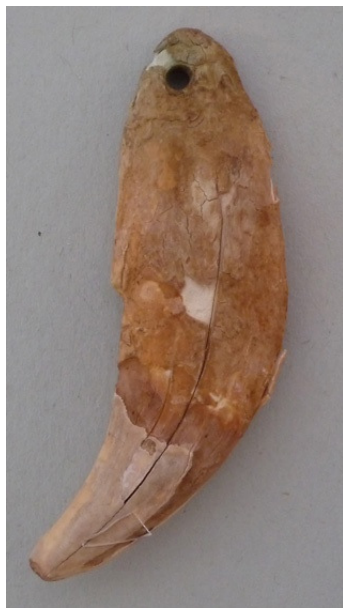
Abb. 5: Bärenzahn Weingarten 778, M 1:1;

In den weiteren Gräberfeldern der eingegrenzten Region konnten Bärenzähne ausschließlich als Beigabe weiblicher Individuen der Alterstufen infans I (2x), infans II (3x) und adult (5x) beobachtet werden. Der Zeitraum ihres Erscheinens erstreckt sich über die Phasen SW II bis SW IV, wobei sie in letztgenannter bereits seltener anzutreffen sind. Mehrheitlich konnten Bärenzähne im Bereich der Gürtelgehänge lokalisiert werden; in Schretzheim Grab 410 spricht die Lage für eine Trageweise an einer Halskette, in Schleithem befand sich ein Bärenzahn zusammen mit einer organischen Substanz, vermutlich Weihrauch (s. Absatz „Weihrauch“) unter einer Schale zu Füße eines ca. vierjährigen Mädchens. Weitere Beifunde zu den Bärenzähnen für die man einen christlichen Hintergrund annehmen könnte sind eine kreuzverzierte Goldscheibenfibel mit Inschrift (Grab 22) sowie eine Zierscheibe mit einer Swastika im Inneren (Grab 540) von Schretzheim.