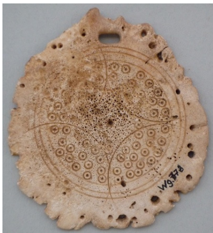
Abb. 4: Hirschgeweihrose Weingarten 778, M 1:1;

In Weingarten beläuft sich die Zahl der Geweihrosen auf sechs Stück, wobei sie knapp über die Hälfte von adulten Frauen getragen wurden. Bei drei Gräbern handelt es sich um die Bestattungen infans I bis II Jahre alter Mädchen. Die Datierungen beschränken sich auf den Zeitraum SW I bis SW II; nur Grab 778 wurde nach SW III bestimmt. In fünf der Gräber konnten die ring- und scheibenförmigen Geweihrosen aufgrund ihrer Lage einem Gürtelgehänge zugeordnet werden. Kreuzverzierte Gegenstände treten nicht gemeinsam mit ihnen auf. In Grab 769 befand sich jedoch ein Adlerfibelpaar, das vermutlich in einem christlichen Zusammenhang zu sehen ist. (s. Kapitel Adler/Vogelfibel) Keines der Gräber enthält eine Edelmetallbeigabe.