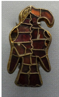
Abb. 10: Adlerfibel Weingarten 736, M 1:1;

Das Inventar des Grabes 736 charakterisiert eine archäologisch weibliche Bestattung, die Skelettreste darin jedoch tragen jedoch männliche Körpermerkmale. Die am Kinn und auf dem rechten Schlüsselbein entdeckten, sich „anblickenden“ beiden kleinen Adlerfibeln zeichnen sich durch ihre besonders schöne Gestaltung aus. (s. Katalog)