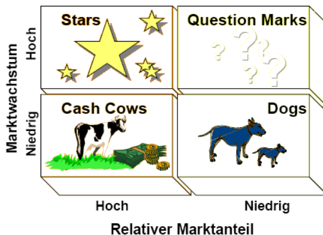
Abbildung 3: Die Marktwachstums – Marktanteils – Matrix von BCG