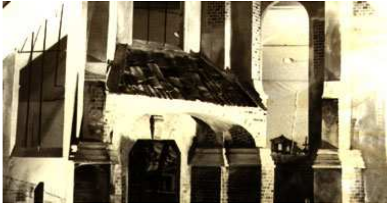
Abbildung 1: Kulisse der Kirchenruine von Rönök

Gegenüber der Kirchenkulisse und frontal zum Publikum manifestiert sich eine Bühneninstallation, welche in ihrer Zeichenhaftigkeit einen Gegenpol zum öffentlichen Gebiet des Gotteshauses darstellt. Der Zuschauer wird mit einer Bühne konfrontiert, welche als Interieur angelegt ist und solcherart die Privatheit und Enge künstlerischen Daseins ausstellt. Vermittels reduzierter, plakativ eingesetzter Requisiten entsteht ein prägnanter Innenraum. Dieser fungiert als multiple Projektionsfläche für innerpsychologische Prozesse der Figur des sterbenden Jan Rys.