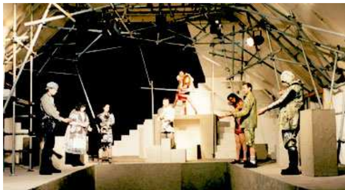
Abbildung 4: Positionierung der Schauspieler im Horvathschen Bühnenraum

Die Verschachtelung der kantigen Objekte bietet den Schauspielern die Möglichkeit, sich durch die Positionierung im Raum voneinander abzugrenzen und ihren Part innerhalb des Figurengefüges durch das ständige Spiel mit den Objekten gezielt herauszustellen. Gleichzeitig entstehen durch die Begehbarkeit der kantigen Körper Schlupflöcher und Rückzugswinkel im Hintergrund der Oberflächendarbietung. Das von Horvath geschaffene Stufenarrangement bietet die Möglichkeit zur visuellen Darstellung des komplexen Figurengefüges. Auf den Premierenfotos (vgl. Abb.4, Abb.6) erscheinen die agierenden Figuren stilisiert im Hinblick auf deren Positionierung im Raum. Insgesamt ergibt sich ein Gesamteindruck einer zackigen Härte, die agierenden Personen sind als fremd gesteuerte Objekte innerhalb eines eingefrorenen Arrangements kenntlich gemacht. Der eingefrorene, erstarrte Gestus der Inszenierung ist durch den Bühnenbildentwurf Wolfgang Horvaths vorgegeben: Horvath setzt auf die Installierung komplexer Stangenvorrichtungen, welche als visuelles Leitmotiv und Rahmung der Bühne fungieren und stetig in den inneren Kern der Darstellung einzubrechen drohen: