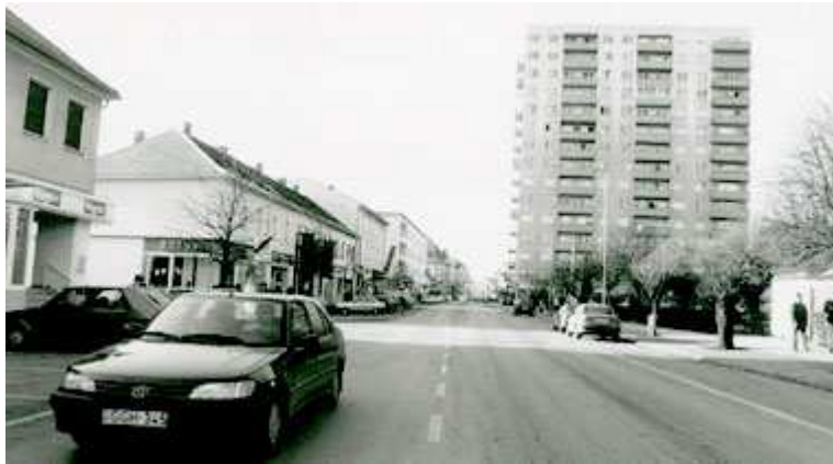
Abbildung 3: Hauptstraße von Oberwart, festgehalten auf der Homepage Peter Wagners

„In einer wirklich schönen Stadt lässt es sich auf Dauer nicht leben: Sie treibt einem alle Sehnsucht aus.“ 2