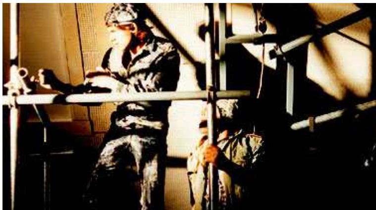
Abbildung 6: Stahlvorrichtungen und Schauspielerkörper

Abbildung 6 zeigt einen der männlichen Protagonisten im Vordergrund in der Mitte des Bildes stehend, dahinter ist die Silhouette einer weiteren – auf dem Boden hockenden – Bühnenfigur sichtbar. Die beiden menschlichen Körper auf der Abbildung scheinen sich im undurchlässigen Wechselspiel aus Licht und Schatten sowie im harten Arrangement des sie umgebenden Gerüsts zu verlieren.