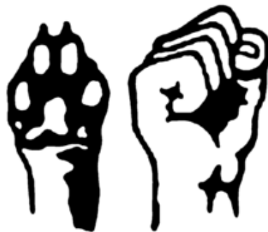
Abb. 2: Eines von vielen Symbolen der Tierrechtsbewegung, welches Solidarität mit Tieren verdeutlicht (identity frame).

„Die Tierrechtsbewegung und Tierbefreiungsbewegung hingegen sind abolitionistisch, drängen auf Abschaffung der Tieraussbeutung und auf einen grundlegenden Wandel der Mensch-Tier-Beziehungen.“ (ebd.: 10ff.) Weiters unterscheidet die Autorin des Textes „In sozialer Bewegung für Tiere – die Tierrechtsbewegung und Tierbefreiungsbewegung“ (2003) zwischen eben diesen beiden Konzepten: erstere rekurriert auf Rechte, die andere auf die Befreiung der Tiere durch den Menschen. (vgl. ebd.: 14)