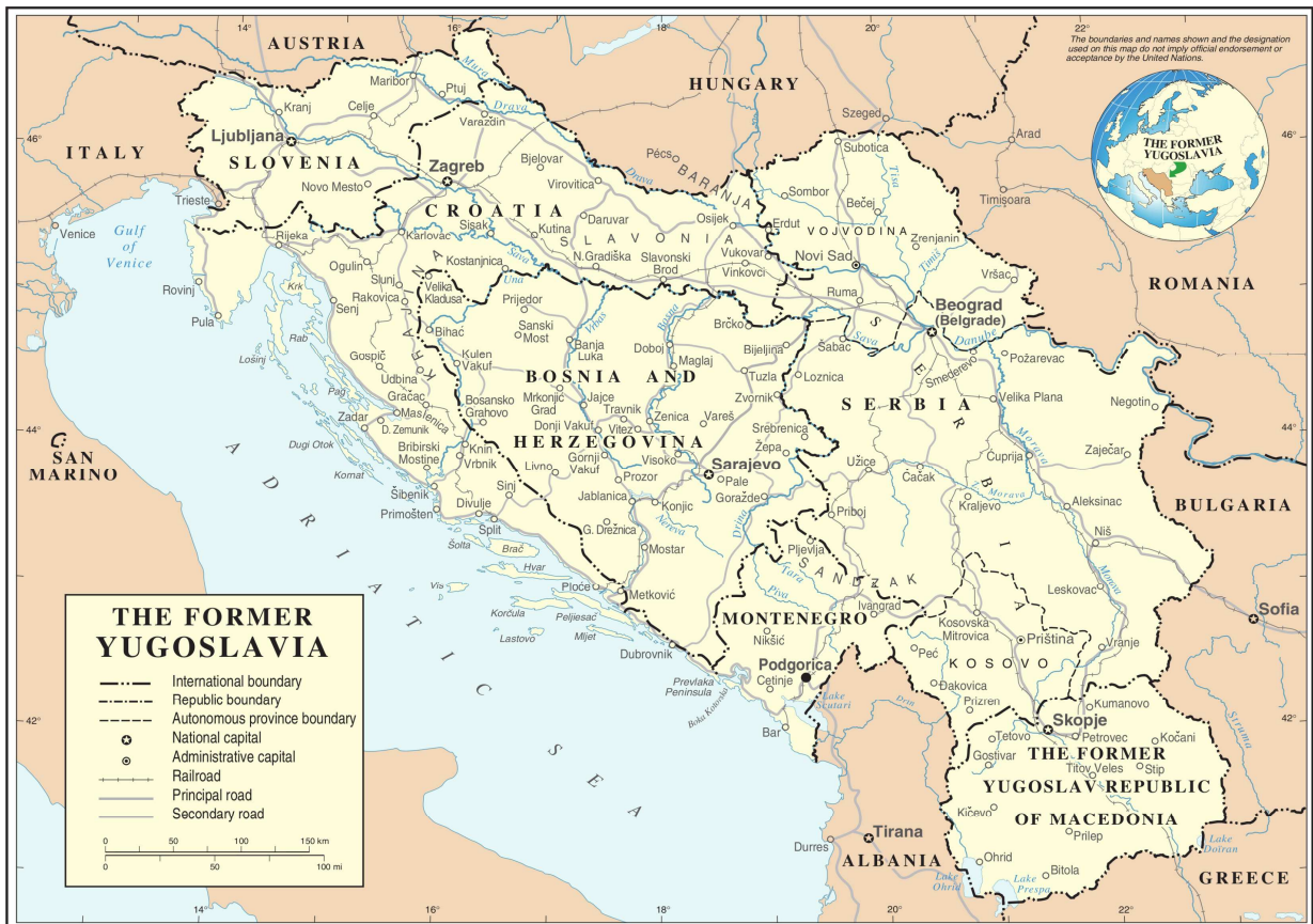
Abb. 2: Karte Jugoslawiens