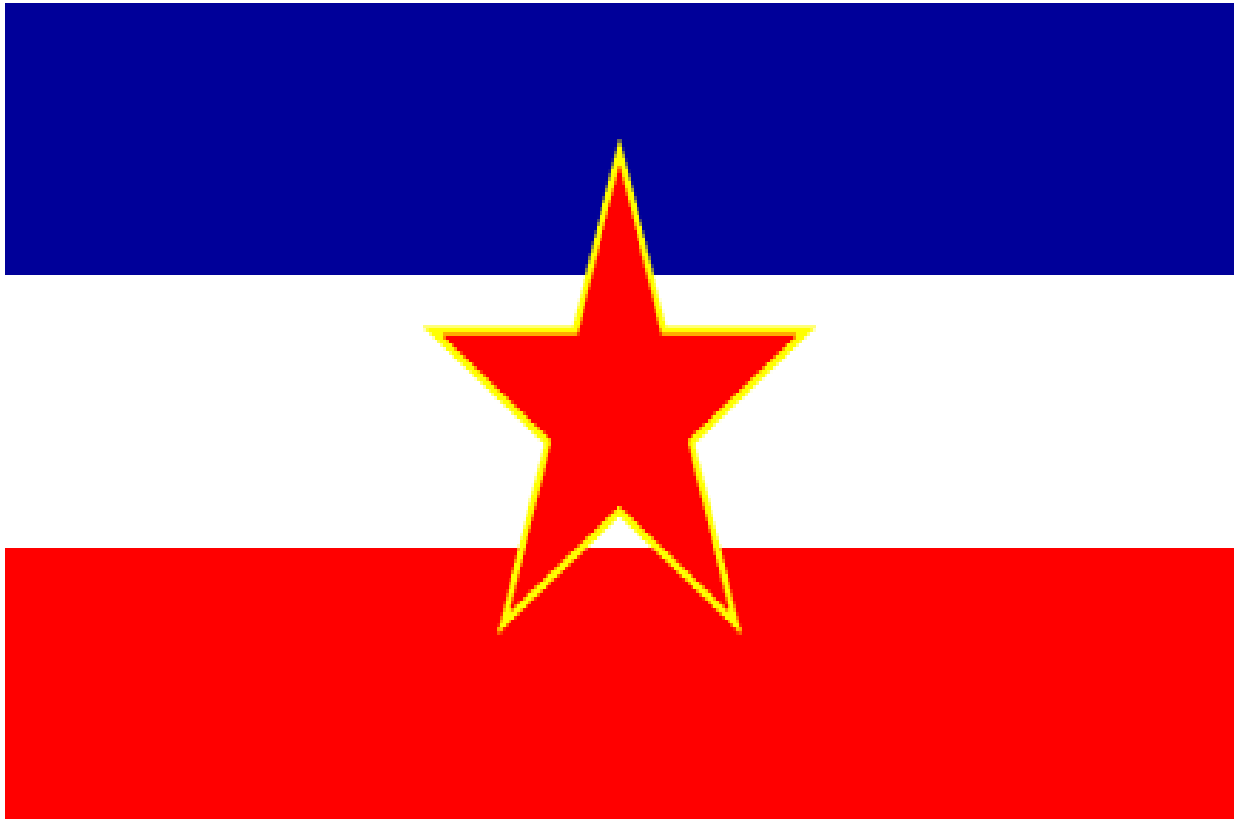
Abb. 1: Flagge Jugoslawiens