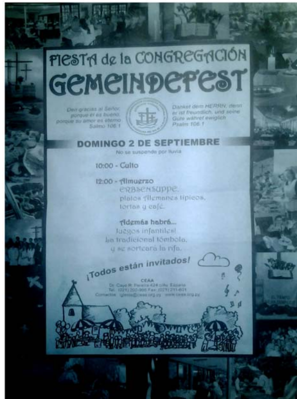
Abb. 3c: Einladung zum Gemeindefest

Dieser Flyer wurde unter der Deutschen Community in Asunción verteilt. Das Gemeindefest wird jedes Jahr im September veranstaltet und findet großen Anklang bei der Gemeinde.