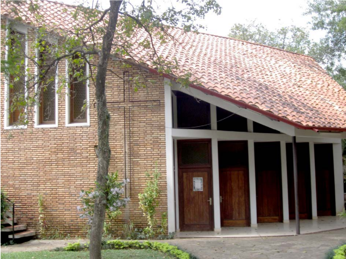
Abb. 3a: Evangelische Kirche in Asunción

Die evangelische Kirchengemeinde zählt ungefähr 5000 Mitglieder, fast alle stammen von deutschen Auswanderern ab.