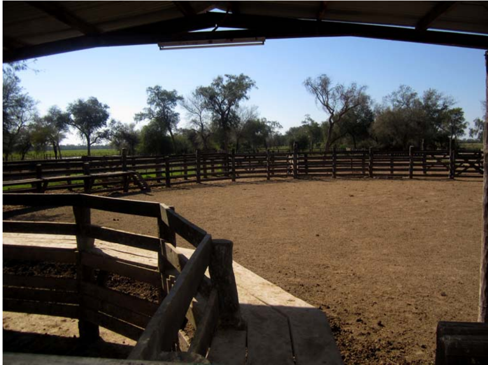
Abb. 7b: Corral - Innenansicht

Ganze Rinderherden werden zunächst von Troperos (in Argentinien auch als Gauchos bezeichnet) zusammengesammelt und dann einzeln durch das Corral geleitet.