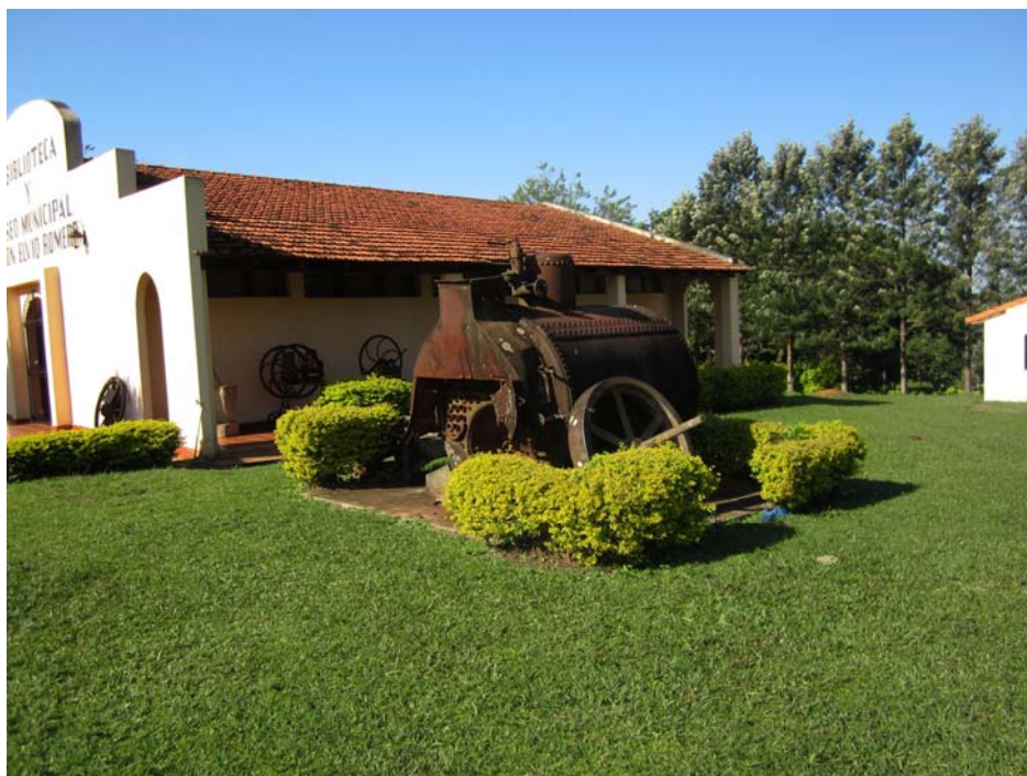
Abb. 4a: Heimatmuseum in der Kolonie Yegros

Dieser Flyer wurde unter der Deutschen Community in Asunción verteilt. Das Gemeindefest wird jedes Jahr im September veranstaltet und findet großen Anklang bei der Gemeinde.