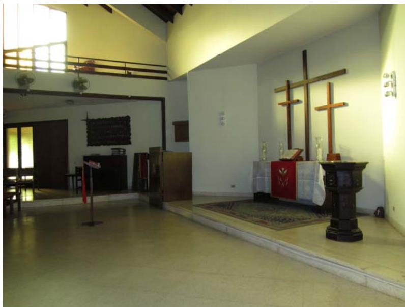
Abb. 3b: Innenansicht der Evangelischen Kirche in Asunción

Die evangelische Kirchengemeinde zählt ungefähr 5000 Mitglieder, fast alle stammen von deutschen Auswanderern ab.