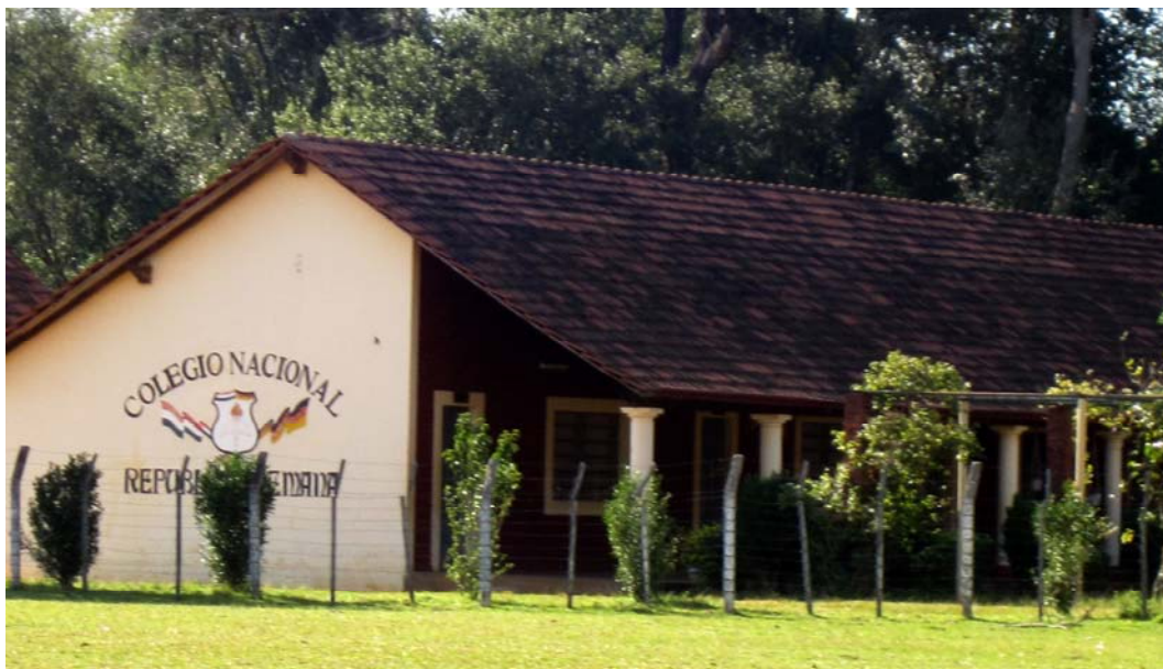
Abb. 5: Die neue Deutsche Schule in Yegros Die Schüler erhalten Unterricht nach dem paraguayischen Lehrplan – einige Unterrichtsstunden pro Woche finden aber auch in deutscher Sprache statt.