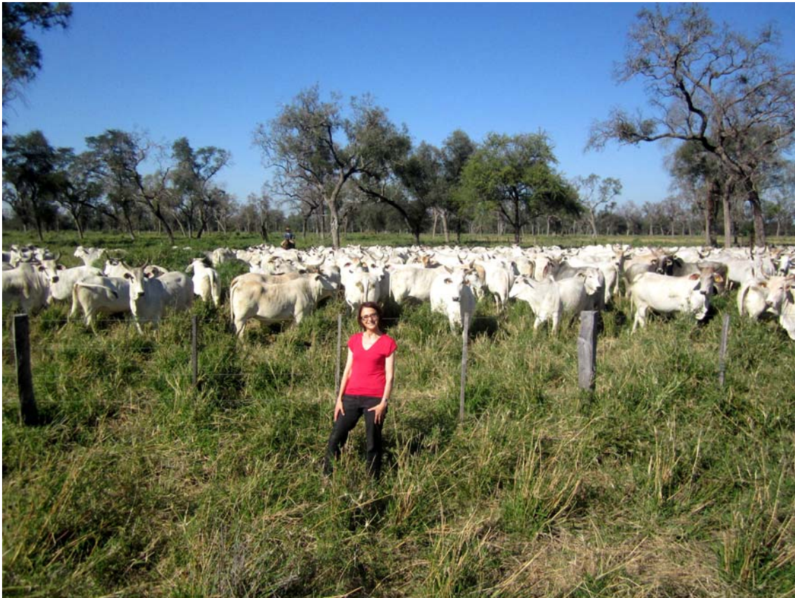
Abb. 9: Rinderherde im Gran Chaco

Hier weidet eine besondere Rinderrasse, die aus Nelore-Rindern und aus Brahman-Rindern gezüchtet wurde.