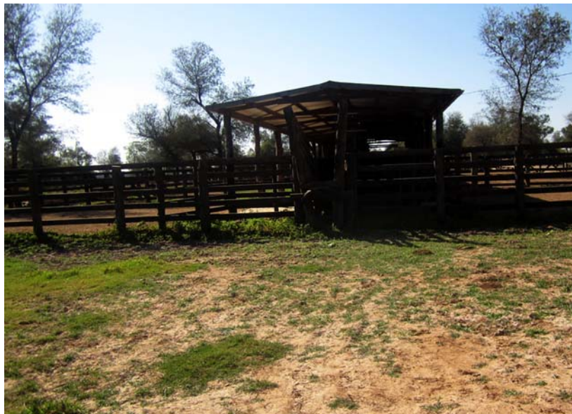
Abb. 7a: Corral von Außen

Gesetzlich ist geregelt, dass etwa ein Drittel einer Estancia Urwald bleiben muss – der Rest der Fläche ist in Weidezonen unterteilt. Die Rinder ziehen alle paar Tage auf eine neue Weidefläche.