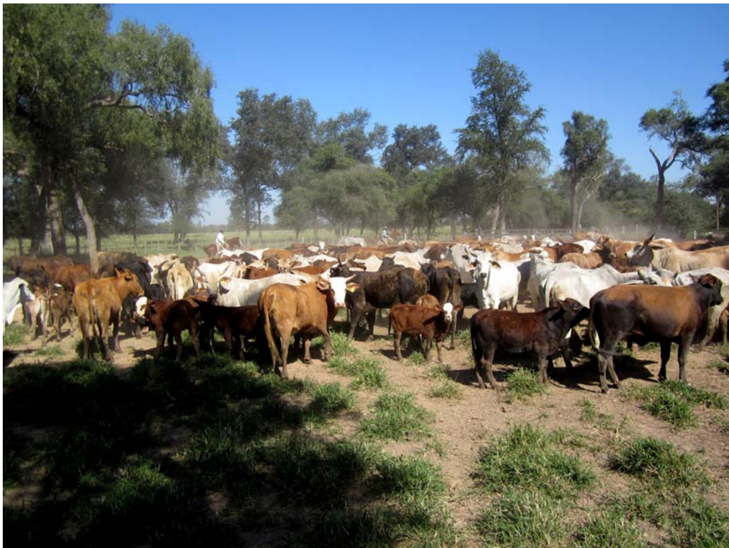
Abb. 8: Gemischte Rinderherde im Gran Chaco

Ganze Rinderherden werden zunächst von Troperos (in Argentinien auch als Gauchos bezeichnet) zusammengesammelt und dann einzeln durch das Corral geleitet.