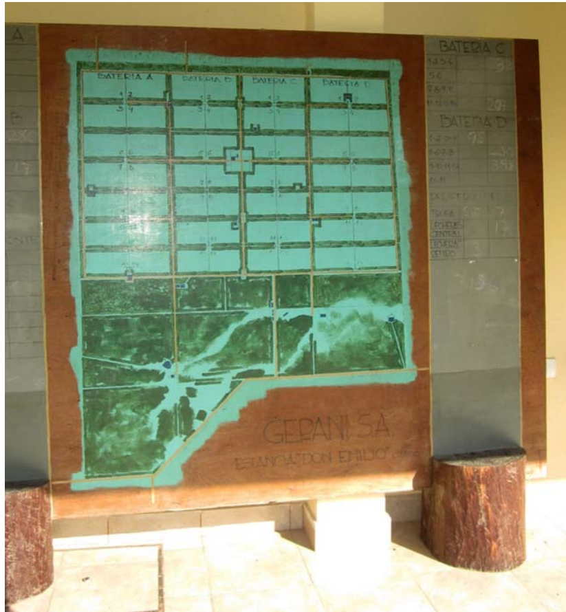
Abb. 6: Plan einer Estancia (Rinderfarm in Paraguay)

Gesetzlich ist geregelt, dass etwa ein Drittel einer Estancia Urwald bleiben muss – der Rest der Fläche ist in Weidezonen unterteilt. Die Rinder ziehen alle paar Tage auf eine neue Weidefläche.