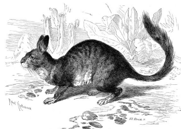
Abbildung 2: Hasenmaus

http://upload.wikimedia.org/wikipedia/commons/8/8e/Hasenmaus_(Lagidium_Cuvieri).png?uselang=de [11.03.2011].