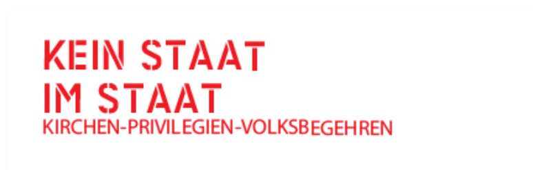
Abbildung 1: Werbebanner für das Volksbegehren.

Da, wie bereits erwähnt, der Erfolg als durchaus aussichtsreich erscheint, 412 kann mit einer Einleitung des Volksbegehrens gerechnet werden. Ob die folgenden 100.000 Stimmen erreicht werden, sei dahingestellt. Insgesamt sei anzumerken, dass die Form der Volksbefragung ein akkurates Mittel zur Durchsetzung des plebiszitären und damit demokratischen Gemeinwillens innerhalb des österreichischen Politsystems darstellt.