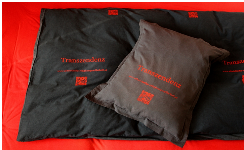
Abbildung 2: Fotografie des materialisierten Transzendenzbezuges.

Den letzten Punkt des Zeichens zentralen, religiösen Wesens sehen sie in der Herstellung eines genuin materialistischen Transzendenzbezuges. So wurde von Wilfried Apfalter im Siebdruckverfahren auf einen Bett- und Polsterbezug Transzendenz gedruckt und damit handgreiflich gemacht.