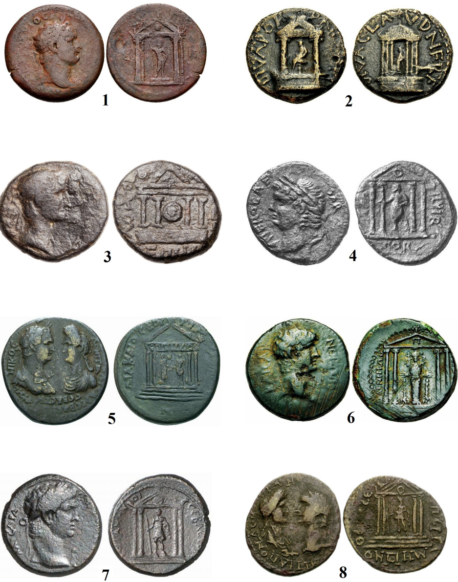
Tafel 1 Alexandria, Caesarea Philippi-Panias, Korinth, Laodikeia am Lykos, Magnesia am Mäander, Pergamon