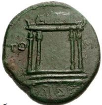
Tafel 2 Smyrna, Teos, Cistophoren, Lykischer Bund, Thessalischer Bund Tavium, Tomoi