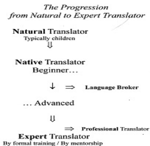
Abbildung 1: Entwicklung zur ExpertIn (Harris 2010a).

An die natürlichen spontanen DolmetscherInnen, die meist, aber nicht nur, im Kindesalter 24 anzutreffen sind, schließen die native translators an, also Zweisprachige, die keine spezifische Ausbildung absolviert haben, aber ihre Fähigkeiten durch Weiterbildung und Erfahrung erworben haben. Die Bezeichnung native translator wurde von Gideon Toury geprägt, der davon ausging, dass native translators so dolmetschen lernen wie MuttersprachlerInnen ihre Sprachen sprechen lernen. Da in den meisten Gesellschaften zwei oder mehrere Sprachen gesprochen werden, eine Vielzahl an Sprachkursen angeboten werden und das Lesen von übersetzter Literatur oder von Büchern in der Originalsprache zum Alltag gehört, können native translators die gleiche Kompetenz wie ausgebildete DolmetscherInnen erreichen. In dieser Kategorie wird eine weitere Klassifizierung in Anfänger und Fortgeschrittene vorgenommen, da ein Unterschied besteht zwischen dem Wissensstand von Schulkindern und der Erfahrung und Kompetenz, die sich beispielsweise eine LiteraturübersetzerIn im Laufe der Jahre angeeignet hat. Harris geht davon aus, dass die Mehrheit der BerufsdolmetscherInnen advanced native translators repräsentieren (vgl. Harris 2009a).