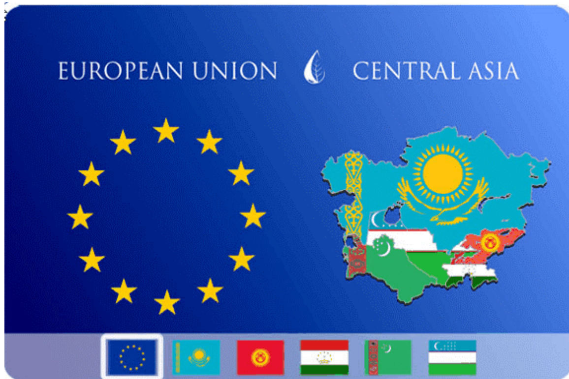
Abbildung 1: Europäische Union und Zentralasien (Amu Darya Basin Network 2013)