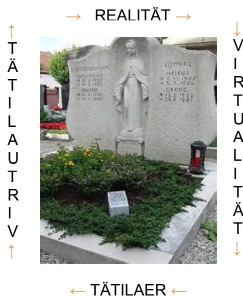
Abb. 12 Kreislauf Realität ☺ Virtualität