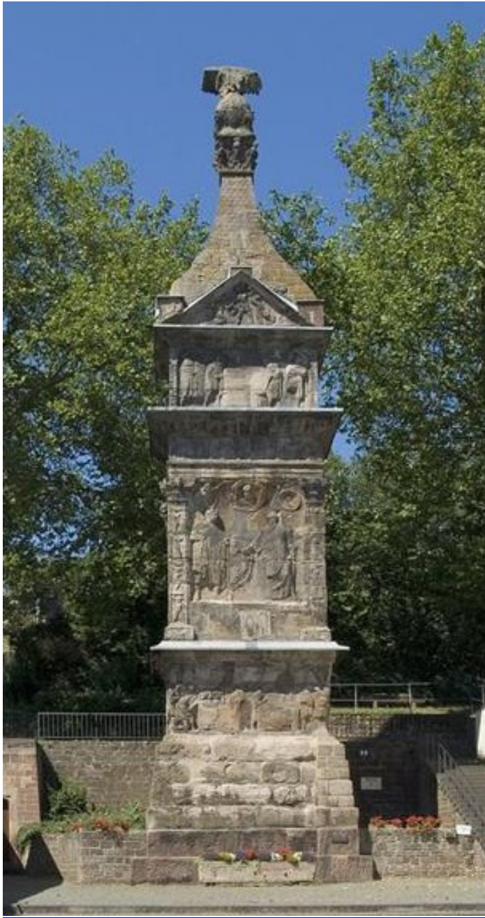
Abb. 6 Igeler Säule