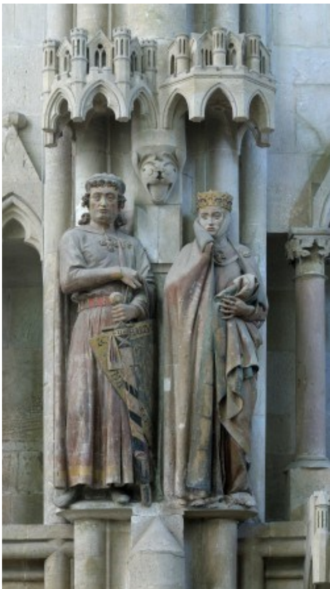
Abb. 4 Naumburger Stifterfiguren