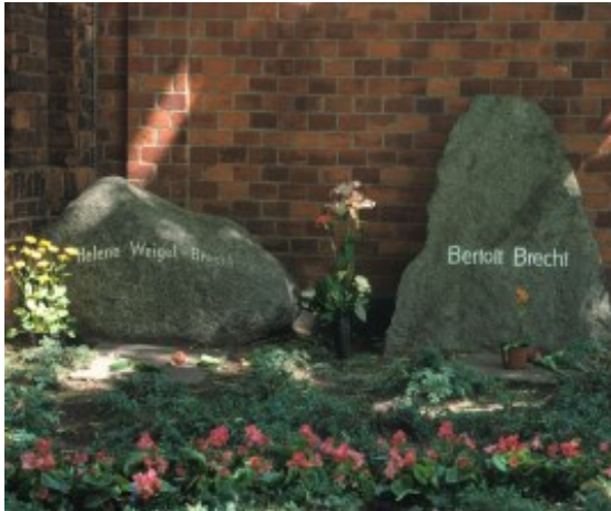
Abb. 3 Grab Ehepaar Brecht