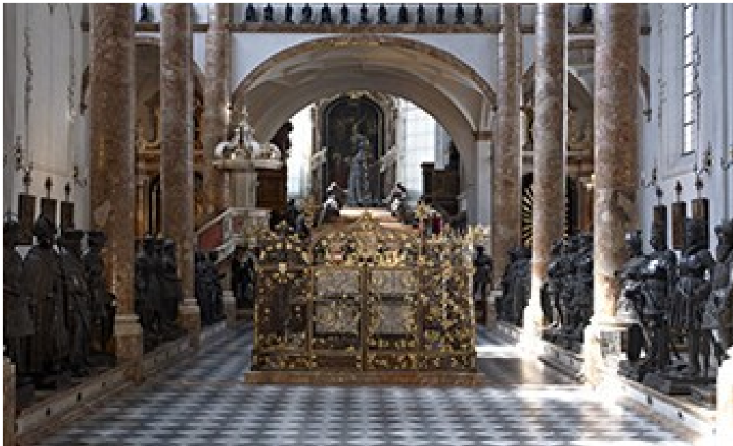
Abb. 5 Grabmal Maximilian I.