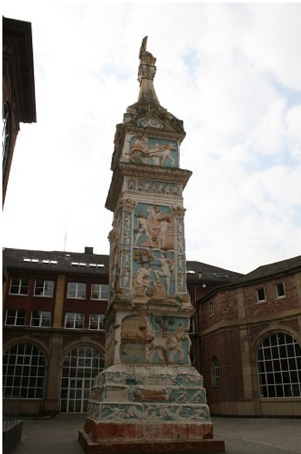
Abb. 7 Nachbildung der Igeler Säule