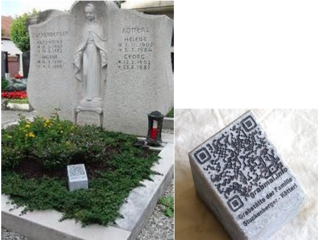
Abb. 11 Realer Grabstein 2012