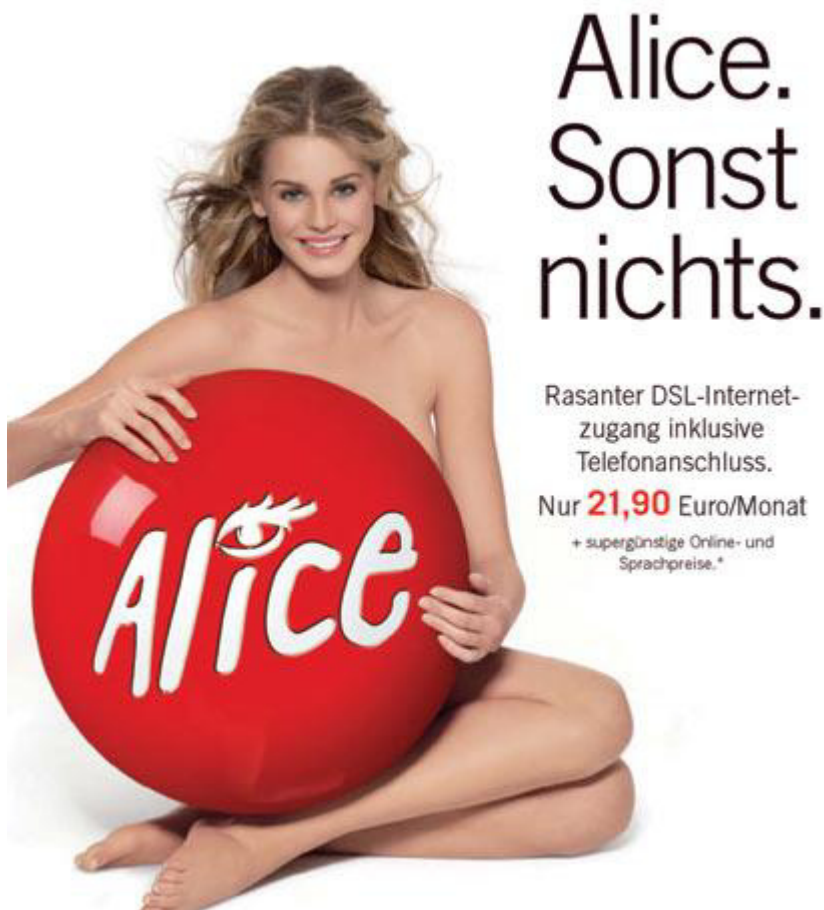
Abbildung 8: Erotischer Appell der Firma Alice

In der Untersuchung wurden nicht nur Appelle mit negativen Emotionen eingesetzt (wie Schuld und Furcht). Es kamen auch angenehmere emotionale Appelle zum Einsatz, um einen Gegenpol zu den negativen Appellen herzustellen und die Diskussion zu fördern und ausgeglichener zu gestalten. Zudem sind den Teilnehmern hierdurch weitere Vergleichsobjekte für die Schuldappelle gegeben. Hier sollen nun die erotischen Appelle vorgestellt werden, angefangen mit der Werbung der Firma Alice.