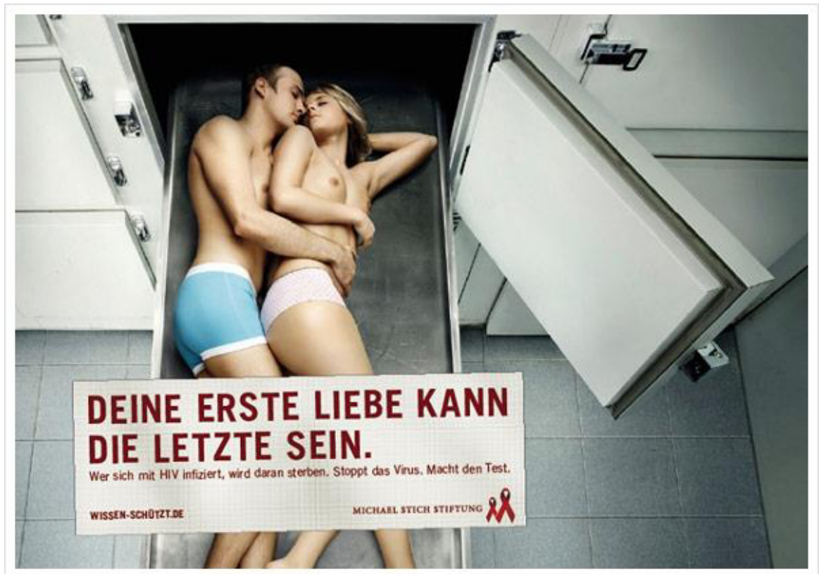
Abbildung 7: Furchtappell der Michael Stich Stiftung

Passivrauchen für Kinder schädlich ist und man die Lebensqualität von Kindern verbessert, indem man in ihrer Gegenwart nicht raucht. In diesem Fall käme prosoziales Verhalten ins Spiel. Bei diesem Appell ist dies jedoch nicht der Fall. Der zweite Furchtappell der Michael Stich Stiftung warnt ebenfalls vor den Folgen einer Krankheit und zwar vor AIDS: