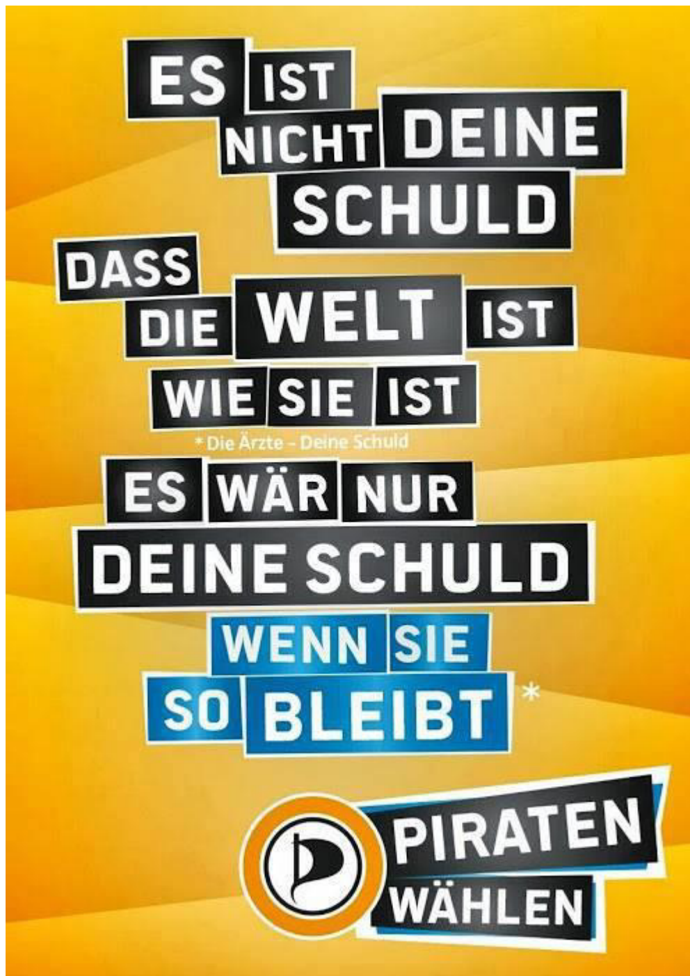
Abbildung 5: Schwacher Schuldappell der Partei "Piraten"

Der zweite schwache Schuldappell der Partei „Piraten“ stellt die Opfer des Fehlverhaltens ebenfalls nicht dar: