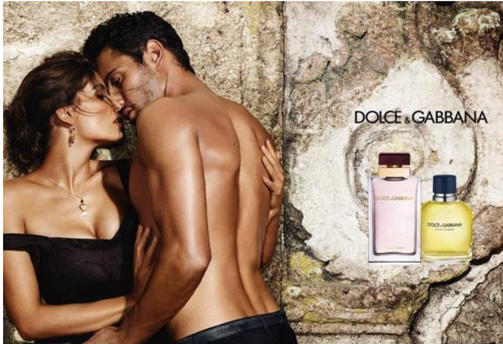
Abbildung 9: Erotischer Appell der Firma Dolce&Gabbana

Im zweiten erotischen Appell von Dolce & Gabbana wird nicht nur ein weibliches Modell gezeigt, sondern ein Paar: