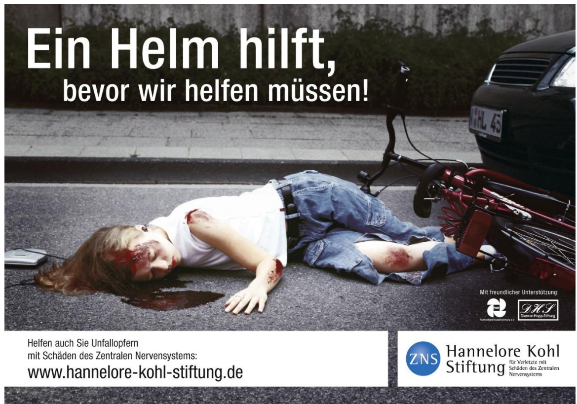
Abbildung 2: Starker Schuldappell der Hannelore Kohl Stiftung

Falle der Untersuchung bestand die Gefahr, dass eventuelle Voreinstellungen einen Einfluss auf die Diskussion haben und zu Verzerrungseffekten führen können. Die professionelle Aufmachung macht diesen potenziellen Nachteil jedoch wett. Tatsächlich waren die Anzeigen den Teilnehmern größtenteils unbekannt. Alle Anzeigen sollen nun kurz vorgestellt werden, angefangen mit den starken Schuldappellen und der Werbeanzeige der Hannelore Kohl Stiftung: