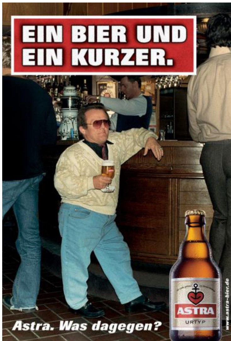
Abbildung 11: Humorvoller Appel der Biermarke Astra

Die Überraschung in diesem Fall entsteht durch die ungewöhnliche Körpergröße des Bier trinkenden Mannes an der Bar. Humor wird durch die Doppeldeutigkeit des Anzeigentextes „Ein Bier und ein Kurzer“ erzeugt. Diese Doppeldeutigkeit nimmt Bezug sowohl auf die umgangssprachliche Bezeichnung „ein Kurzer“ für ein alkoholisches Getränk, welches in einem 2cl oder 4cl Glas – meist auf einen Schluck – getrunken wird als auch auf den kleingewachsenen Mann an der Bar. Dieses Wort und Gedankenspiel greift auf eine Form von Humor zurück, die Andrews (1943, zitiert nach Guilford, 1974, S.445) als „witzigen Humor“ bezeichnet. Mit den drei starken und zwei schwachen Schuldappellen sowie jeweils zwei Furcht-, Erotik- und humorvollen Appellen wird den Diskussionsteilnehmern ein breites Spektrum an emotionalen Appellen vorgelegt. Insgesamt fünf Schuldappelle stellen dabei sicher, dass diese unter den anderen emotionalen Appellen dominant sind. Der Fokus der Untersuchung auf Schuldappelle spiegelt sich hier wieder. Die Auswahl der Appelle erfolgte per Internetrecherche.