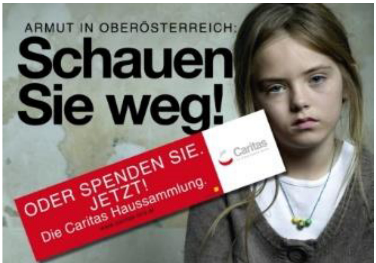
Abbildung 1: Starker Schuldappell der Caritas Haussammlung

Nun soll anhand dieser Werbeanzeige der Caritas Haussammlung beispielhaft die Erzeugung von Schuldgefühlen im Rezipienten erklärt werden.