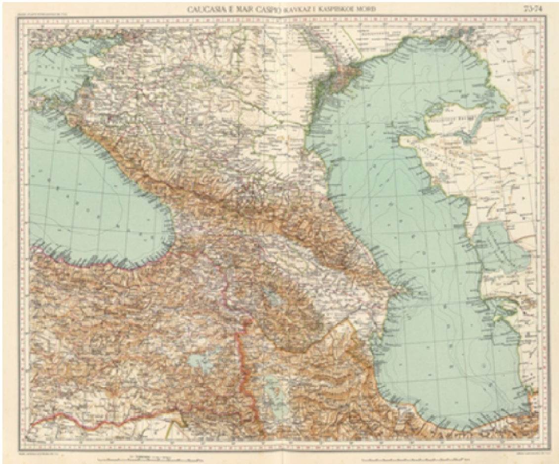
Kaukasus: die politische und physische Karte, 1929 280