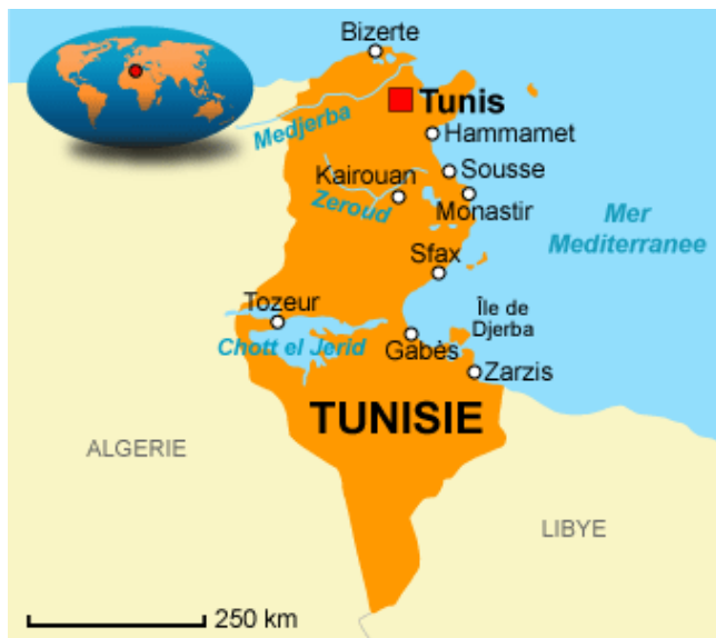
Illustration 5: Carte géographique de la Tunisie