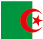
Illustration 2: Drapeau de l'Algérie