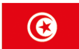
Illustration 6: Drapeau de la Tunisie