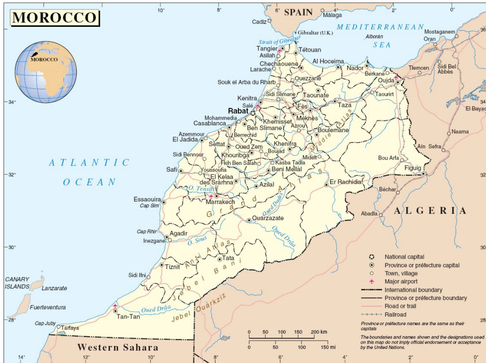
Illustration 3: Carte géographique du Maroc