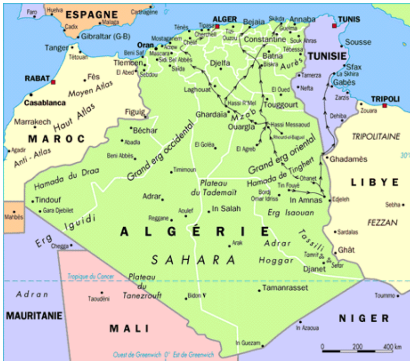
Illustration 1: Carte géographique de l'Algérie