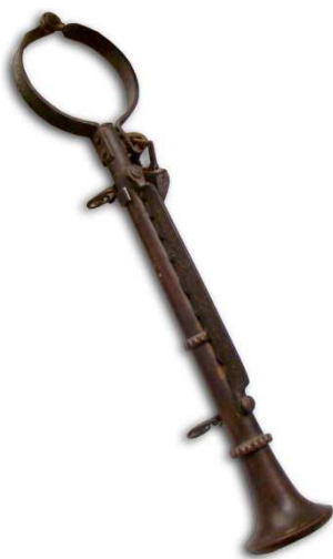
Abb. 1: Die Schandflöte 87

Selbstverständlich gab es auch in ständischen Gesellschaften keinerlei rechtsfreien Raum. Man unterschied spätestens rund um das 12. Jahrhundert zwischen niederer und hoher Gerichtsbarkeit, also kleineren (Gotteslästerung, Ehebruch, Diebstahl) und größeren Delikten (Mord, Falschgeld, Hochverrat, Aufruhr). Dabei waren die jeweiligen Grundherren verantwortlich für die niedere Gerichtsbarkeit. Eine Justizform und Rechtsprechung, die, wie man sich leicht vorstellen kann, aber vor allem von Willkür geprägt war. Als einfacher Mann hatte man meist das Nachsehen gegenüber besser gestellten Gesellschaftsmitgliedern, was allzu oft dazu führte, dass Richter einen Fall gar nicht erst verhandelten. Die gewaltsame Folter als probates Mittel, ein Geständnis zu erzwingen war in jenen Gewaltgesellschaften üblich und wurde das gesamte Mittelalter hindurch praktiziert. Das Ergebnis war freilich stets jenes, das die Folterknechte willkürlich im Auftrag des Bessergestellten zutage zu fördern hatten. Das Rechtsprechen war jedoch wiederum keineswegs nur Richtern vorbehalten: Lehnsherren oder Grundherren, obwohl keine Berufsrichter, waren dabei oftmals ebenfalls dazu befugt Recht zu sprechen.