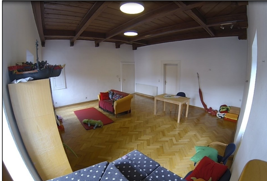
Abbildung 5 Raumbeschreibung Eckkamera

Die Eckkamera ergänzte die Perspektive der Frontalkamera und ermöglichte es jene Szenen aufzunehmen, die sich vorrangig außerhalb des Geschehens mit dem Medium Fernseher und Tablet abspielten.