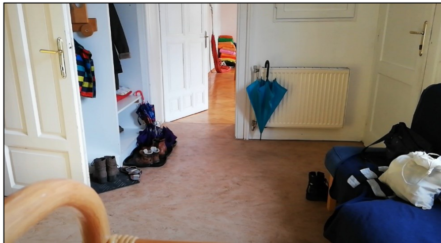
Abbildung 2 Empfangsbereich

Auf diesem Bild ist der Eingangsbereich zu sehen. Die linke Tür führt zu einer Küche, in der das Regiebuch, Kaffee, Tee und Kuchen sowie Dankesgeschenke für Mütter und Kinder vorbereitet waren. In der Küche lagen unter anderem das Tablet und die Fernbedienung, die die Erwachsenen in der jeweiligen Phase ausgehändigt bekamen. Ein Wecker auf dem Küchentisch gab das Signal, wann die Mutter wieder zurück in den Raum zu ihrem Kind gehen sollte.