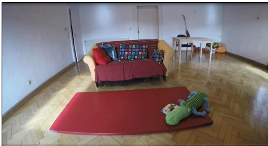
Abbildung 4 Raumbeschreibung Frontalkamera

Aus der Perspektive der Frontalkamera sind zwei Türen erkennbar, eine an der linken Wand und eine weitere gegenüberliegend. Die linke Tür war der Eingang in den Raum, durch den die Proband*innen hereingeführt wurden. Ein gelbes Sofa mit diversen Kissen und Decken steht im Vordergrund. Vor dem Sofa wurde eine rote Matte mit einem Buch sowie einem großen Stofftier platziert. Unterhalb der Frontalkamera standen der Fernseher und ein DVD-Player. In der rechten Ecke des Raumes wurden ein Sessel und ein Tisch für die Mütter platziert. Hinter dem Tisch lagen diverse Polstermöbel auf dem Boden. Die Perspektive der Frontalkamera wurde mit jener der Eckkamera ergänzt und die Videos wurden bei Bedarf zusammengeschnitten.