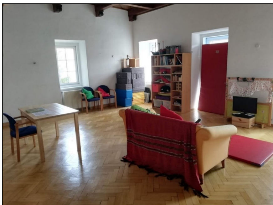
Abbildung 3 Beobachtungsraum