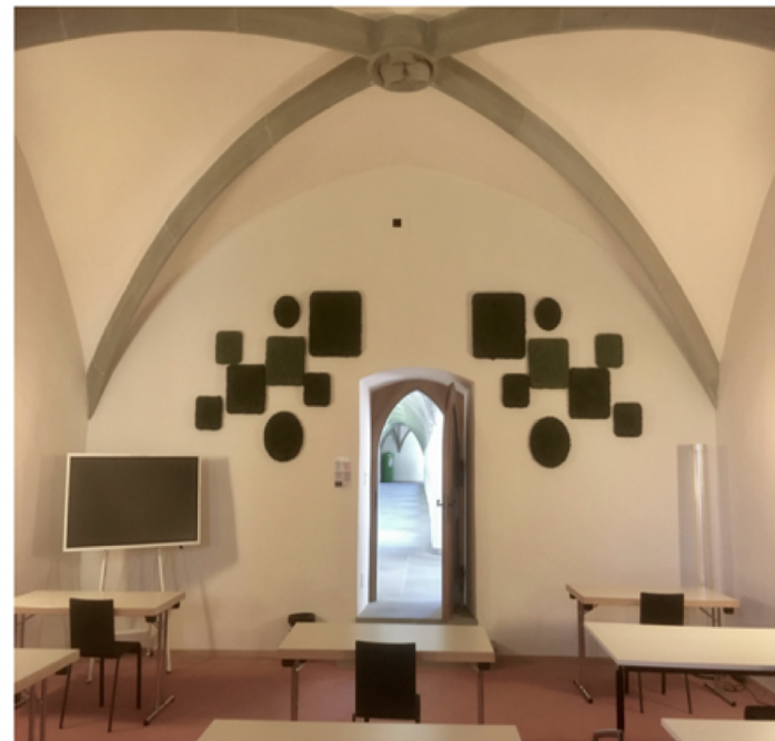
Abb. 17: links: Moos- und Pflanzenwand in der Oodi Helsinki Central Library (2021), rechts: Mooswand im Lernraum der PHSG