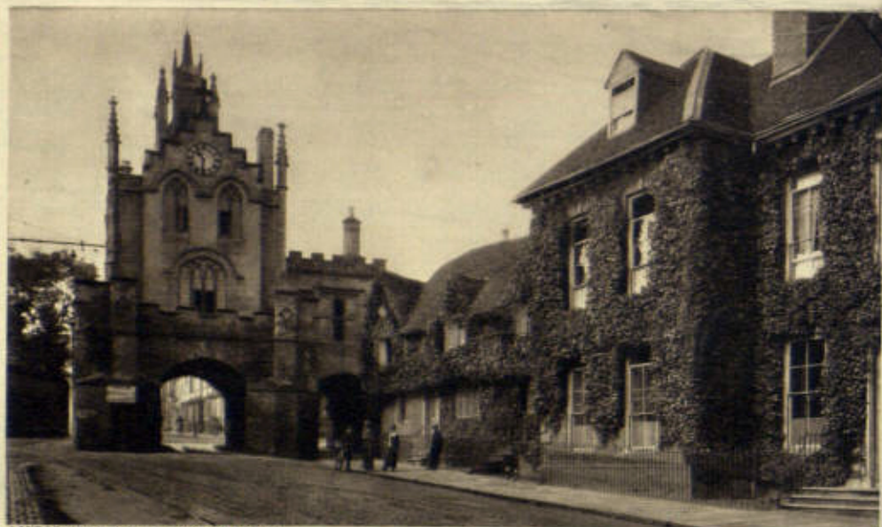
LANDOR HOUSE AND EAST GATE, WARWICK