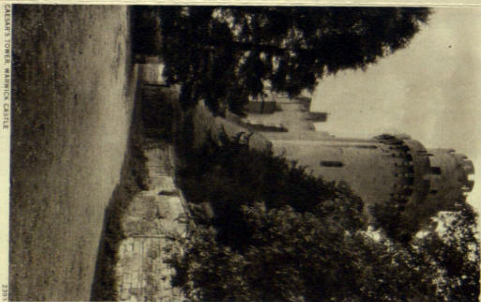
CAESAR'S TOWER, WARWICK CASTLE