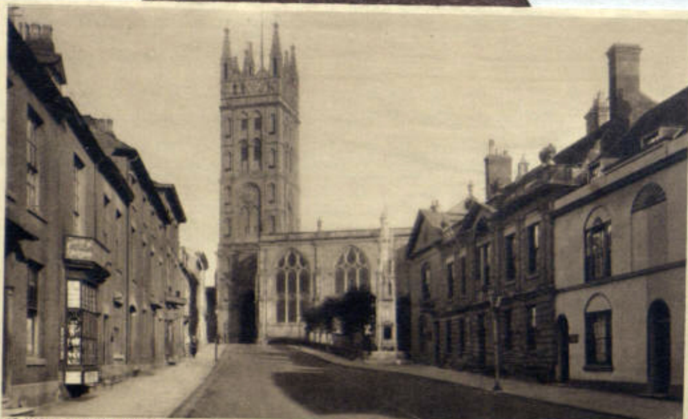
ST. MARY'S CHURCH, WARWICK