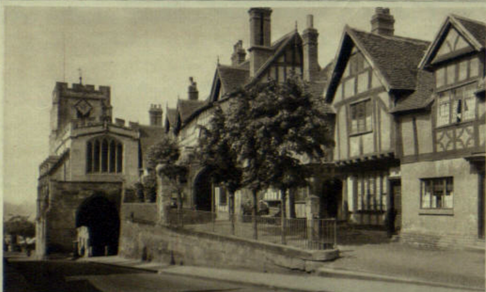
LEYCESTER HOSPITAL AND WEST GATE, WARWICK