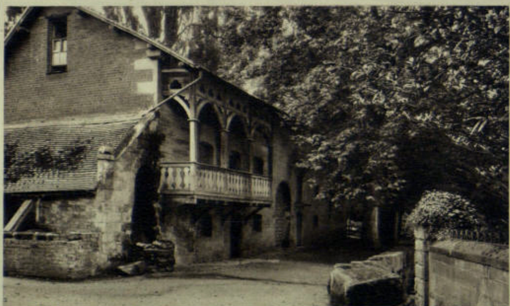
GUY'S CLIFF MILL, WARWICK