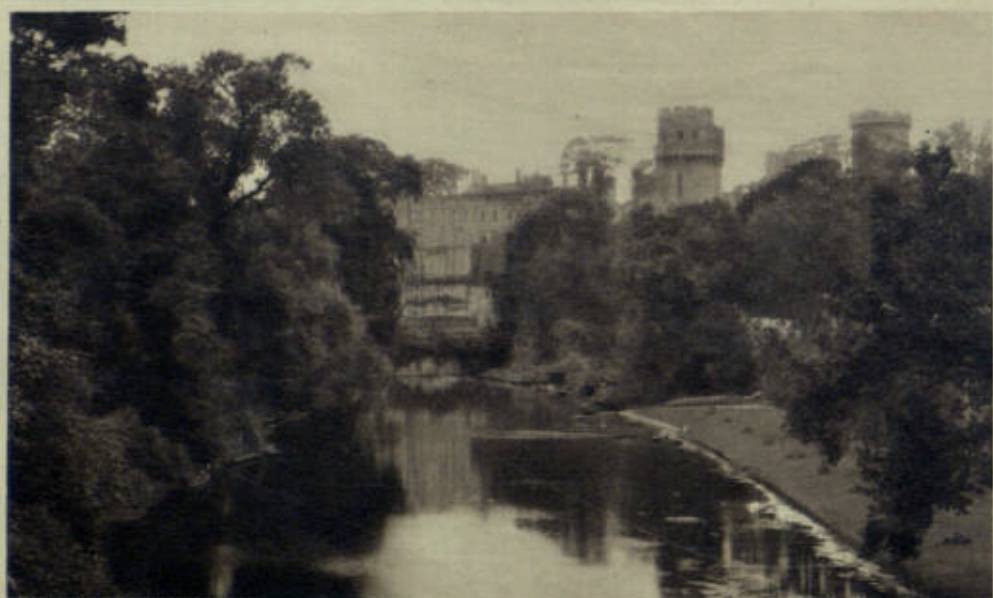
WARWICK CASTLE FROM BRIDGE