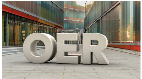
OER-Symbolbild, Uni Graz, CC BY 4.0, https://www.creativecommons.org/licenses/by/4.0/legalcode , https://short.fnma.at/oersymbolbild

Zusätzlich ermöglicht jeder Abschnitt einen Blick in die Hochschulpraxis. Nutzen Sie die QR-Codes, um sich Praxisbeispiele aus unterschiedlichen Hochschulen anzusehen und sich inspirieren zu lassen. Holen Sie sich Ideen für eine offene Hochschulbildung an Ihrem Standort!