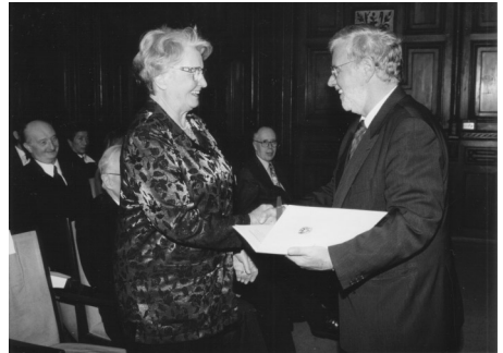
Verleihung des Ehrenkreuzes für Wissenschaft und Kunst, 1999

Und noch eine Entdeckung für den deutschen Sprachraum sei erwähnt. Manche halten gerade dieses Werk für