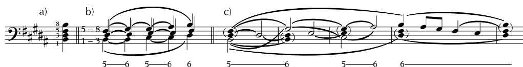
Beispiel 2a: Reduktion von J.S. Bach, Das Wohltemperierte Klavier , Bd. 2, Fuge H-Dur BWV 892: Heinrich Schenker (1925, 97)